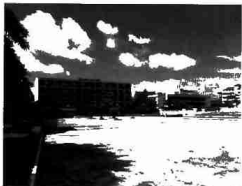
H3 Không gian kiến trúc chưa thể hiện được đặc trưng kiến trúc truyền thống (QT Chao Anouvang)

Với tốc độ phát triển nhanh, cơ cấu quản lý còn nhiều điều bất cập dẫn đến việc các kiến trúc mới không phù hợp với kiến trúc cổ sẵn. Vì thế quảng trường đô thị thành phố chưa thể hiện được mang tính biểu tượng đặc trưng của Tp. Vientiane, có hơn 1.000 năm hình thành và phát triển.