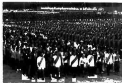
H2 Quảng trường Thatlouang qu "trật trời"

được qui mô của thành phố. Thực vậy, hiện nay toàn thành phố không có lấy một quảng trường đa năng đúng nghĩa để phục vụ các hoạt động sinh hoạt chính trị, văn hóa xã hội của đô thị. Ví thể nhu cầu xây dựng và tổ chức không gian quảng trường đô thị hiện đại của thành phố hiện rất lớn và ngày một tăng cao theo nhịp phát triển chung của đô thị.