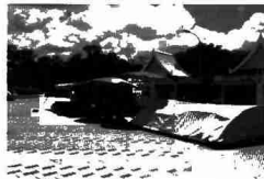
H4 Theo các trục lịch công cộng - quảng trường Chao Fa Ngum

gian quảng trường đô thị cũng vậy, nó chính là nơi cung cấp tác dụng tương hỗ và sự giao lưu quảng đại quần chúng. Trong khi đó, các quảng trường thành phố với mật độ giao thông dày đặc, tốc độ cao như quảng trường That Louang, quảng trường Chao Fa Ngum, quảng trường Chao Anouvang luôn gây cảm giác không an toàn đối với người dân về giao thông, ô nhiễm môi trường... Mặt khác các không gian quảng trường của thành phố chưa tạo nên được sự hấp dẫn cần thiết để thu hút người dân vào các hoạt động công cộng đô thị, đó chính là do mức độ đáp ứng hạn chế nhu cầu người dân đô thị trong các hoạt động do sự thiếu hụt các quảng trường và tổ chức các hoạt động không phù hợp với loại hình và chức năng quảng trường.