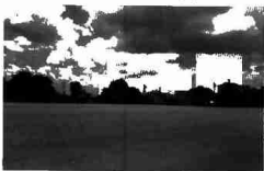
H5 Chưa có hiệu quả thẩm mỹ - quảng trường Thatlouang

Sự tồn tại của quảng trường đô thị cũng liên quan đến sự biến hoá môi trường hình thể và không gian, thời gian xây dựng từ ba phương diện: một là tính trình tự thời gian của việc thực thi và khai thác, suy tính đến việc phát triển hữu cơ, trong quá trình thực thi và khai thác và suy tính đến hình ảnh quảng trường trong các bước, các giai đoạn thực thi khác nhau, hai là sự thay đổi của mối quan hệ giữa người và không gian môi cảnh tùy theo thời gian, trình tự không gian triển khai khi con người vẫn đóng trong môi cảnh, ba là sự thay đổi cảnh quan theo bốn mùa theo thời gian trong một ngày.